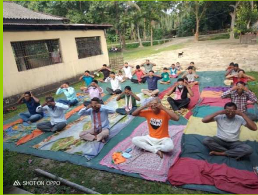
SHOT ON OPPO